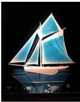
Bateau sur l'eau

L'heure du bain , Triptyque, tirages argentiques d'après impressions numériques 54,5 x 42 cm.