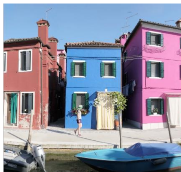
Des tours à Venise

Installation 166 x 200 x 66 cm Photogrammes, bac de rinçage, eau, galets et coquillages. Tirage Julie Laporte & Philippe Bonneau